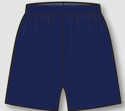
Pantalón buzo azul marino oficial del Colegio