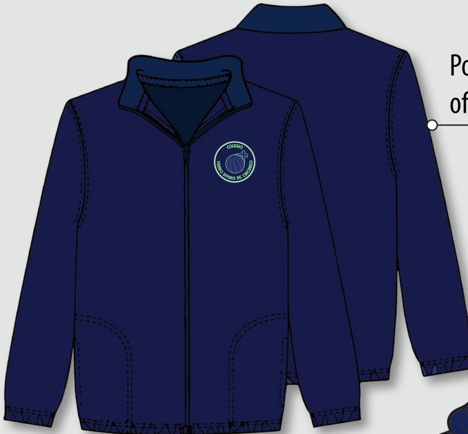
Polerón de polar azul marino oficial del Colegio