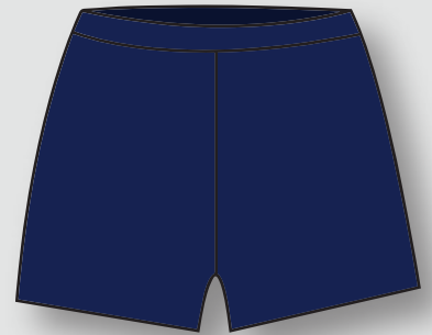
Calza azul marino oficial del Colegio