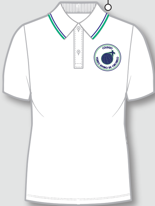
Polera piqué oficial del Colegio