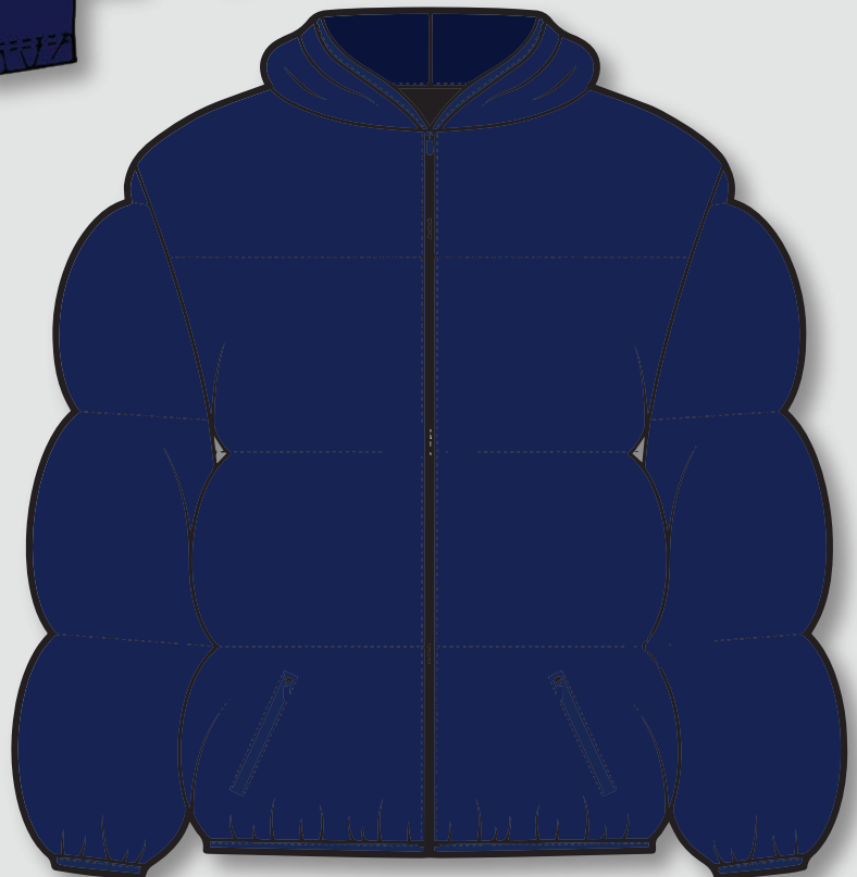
Parka azul marino